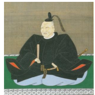
藤堂高虎像 津観音大宝院蔵