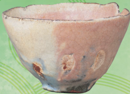
粉引茶碗銘雪の曙 川喜田半泥子作