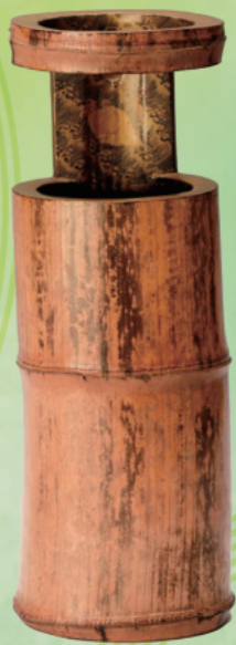
竹一重切花入銘音曲 千利休作