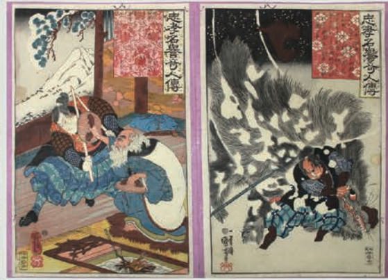
2 忠孝名誉奇人伝 歌川国芳画 天保14~弘化4年(1843~47)