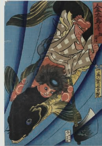
4 金太郎尽五月 歌川芳艶画 弘化4年~嘉永5年(1847~52)