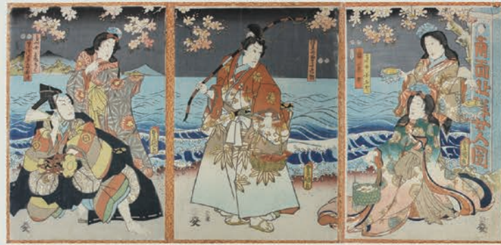
3 嶋廻色為朝 三代歌川豊国画 嘉永6年(1853)