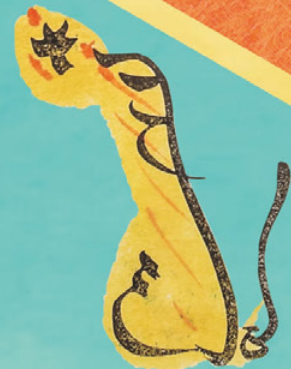
年賀状(反古帖のうち)より 三村竹清画 大正3年(1914) 館蔵