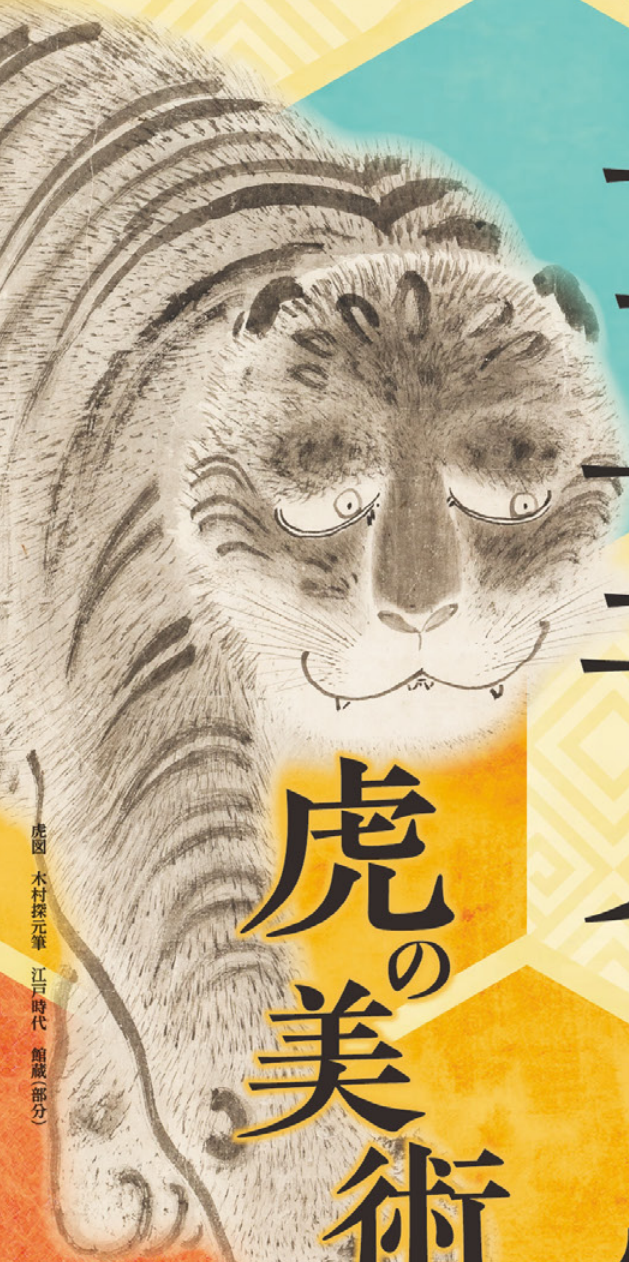
虎図 木村探元筆 江戸時代 館蔵(部分)