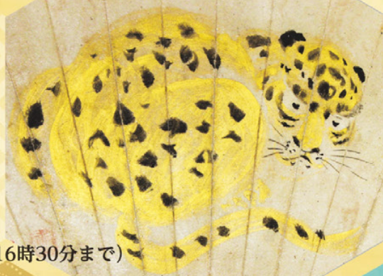
虎図 狩野栄信筆 江戸時代 館蔵(部分)