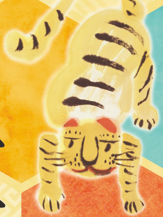
虎図 川喜田半泥子筆 昭和20年代 館蔵(部分)