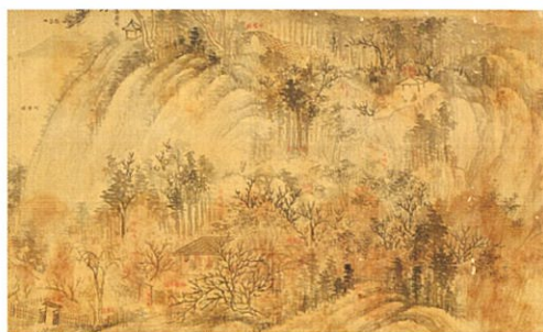
⑥ 天下の文人が集った拙堂の「茶磨山莊」の真景図 茶磨山莊図 宮崎青谷筆