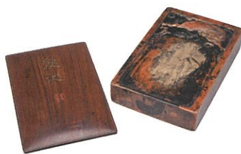
⑤ 藩主高歆から贈られた硯 硯 銘「龍池」 藤堂高歆題