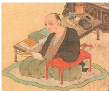
④ 拙堂の面影を伝える奇跡の1幅 齋藤拙堂像 池田雲樵筆