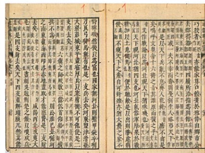
③ 『資治通鑑』を校合・出版せよ! 土井馨牙朱注『資治通鑑』(三重県立図書館蔵)