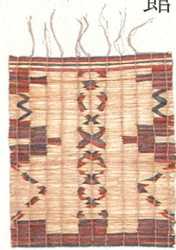
ポンチタラベ (花ごぎ)