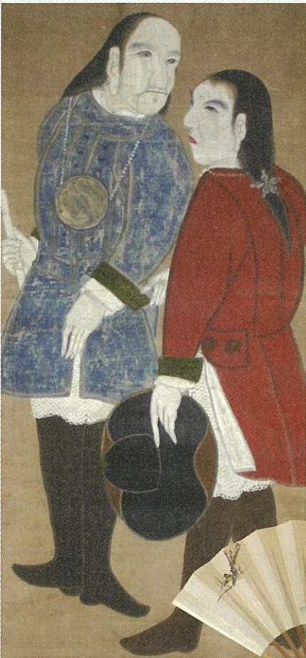
大黒屋光太夫磯吉画幅(大黒屋光太夫記念館蔵)