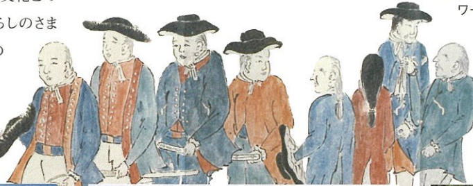
漂流人帰国松前壁之図 (大黒屋光太夫記念館蔵)

※イベントの詳細・最新情報については 国立アイヌ民族博物館のウェブサイトでご確認ください。