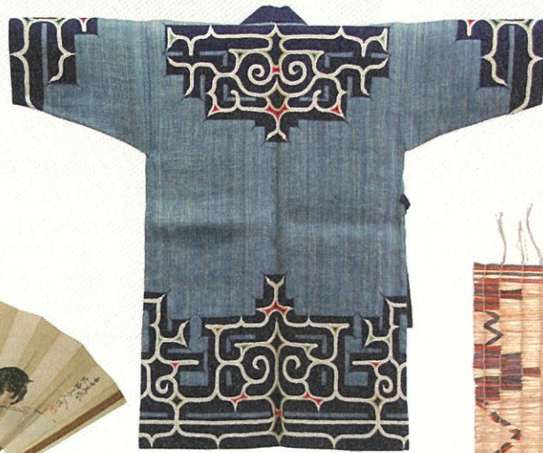
アットウン(樹皮衣)