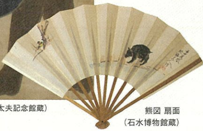
熊図 扇面 (石水博物館蔵)