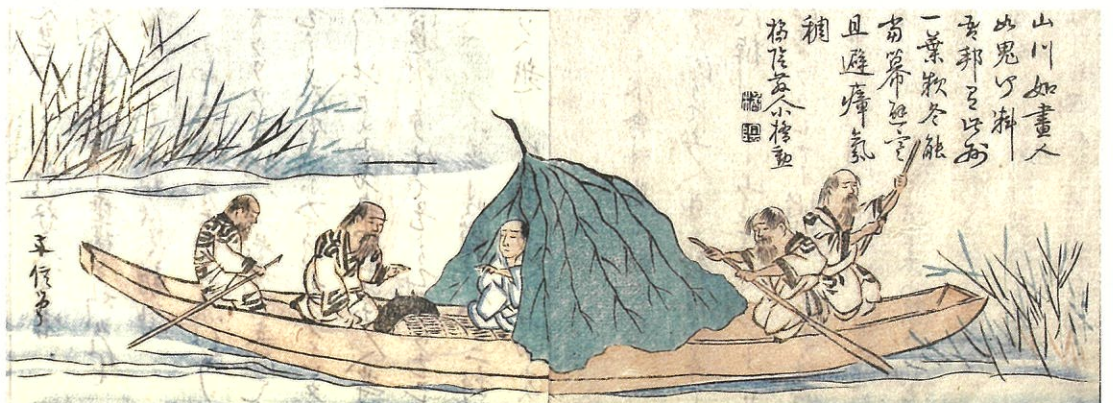
「石狩日誌」(松浦武四郎記念館蔵)