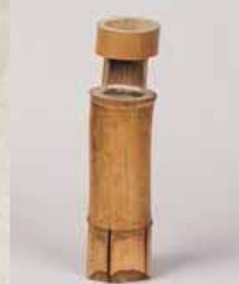
竹一重切花入 銘「移香」 昭和28年(1953)

陶芸家としても知られる創設者川喜田半泥子の周辺調査や作品の紹介は、当館の活動の大きな柱のひとつです。本展では、所蔵品や寄託作品から、川喜田半泥子の陶芸や書画作品、関連資料など約100点を展示いたします。