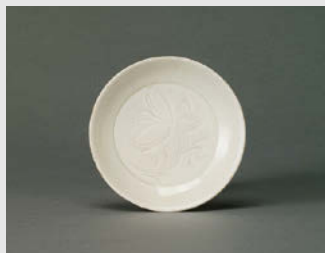
白磁刺花蓮花文小皿 定窯 北宋~金 11~12世紀 口径8.6cm