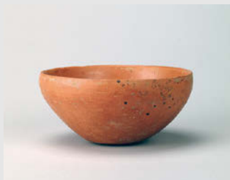
紅陶碗 新石器時代・仰韶文化 前5000~前4000年 高6.3cm