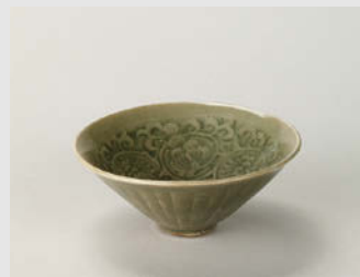
青磁印花唐草文杯 耀州窯 北宋 11~12世紀 高3.8cm