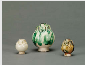
(左) 白磁四耳壺 唐 7~8世紀 高3.0cm (中) 白釉緑彩四耳壺 唐 7~8世紀 高6.1cm (右) 三彩四耳壺 唐 7~8世紀 高3.5cm