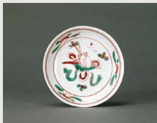
五彩兔文皿 德化窯 清 17~18世紀 口径10.1cm