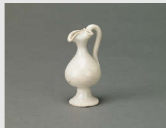
白磁弁口小注 唐 7~8世紀 高7.1cm

中国では、世界で最も進んだ技術と優れた造形性によって、多くの美しい陶磁器が生まれました。その製品には、秦・始皇帝の兵馬俑のように2メートル近い大形品がある一方で、数センチほどの小形品も少なくありません。中国陶磁の伝統の中には、マクロとミクロが共存しているといっても過言ではないのです。