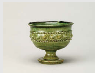
緑釉珠文高脚杯 東漢~北齊 6世紀 高7.8cm