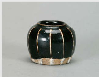
黒釉白堊線文壺 磁州窯系 北宋~金 11~12世紀 高4.7cm