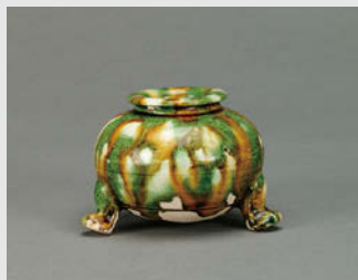
三彩鍍 唐 7~8世紀 高5.6cm