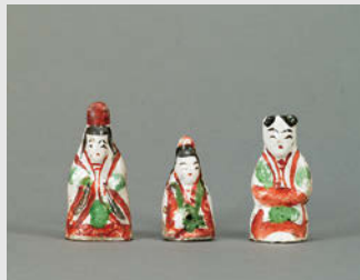
赤絵人形 磁州窯系 金~元 13世紀 高4.7~6.2cm

この展覧会では、中国陶磁の小形品に焦点を当て、紀元前4000年頃の新石器時代から清時代末期までの約6000年間にわたる中国陶磁の歴史を概観する内容となっています。手のひらの上のようになる小さなやきものを通して、中国陶磁の美の世界をお楽しみください。