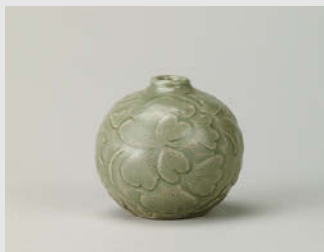
青磁刻花花文壺 越州窯 北宋 10~11世紀 高5.8cm