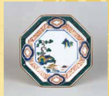
色絵 楼閣山水図脚付八角皿 古九谷様式 江戸時代