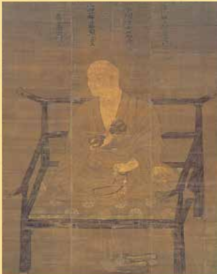
弘法大師像 鎌倉時代 三重県指定文化財(後期展示)