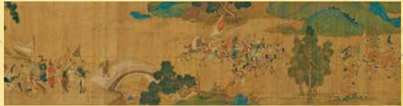
諸夷職貢図(部分) 明時代