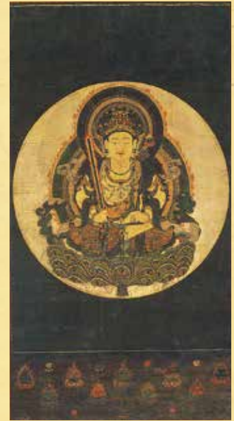
虚空藏菩薩像 南北朝時代 三重県指定文化財 (前期展示)

本展では、近年三重県および津市の文化財指定を受けた寺宝を中心に、同寺に伝わった貴重な密教美術をはじめ、地元津に関係が深い歴史資料、近世絵画や工芸、茶道具などを公開します。