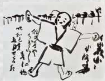
千歳山と半泥子図 昭和34年(1959) 藤田等風コレクション