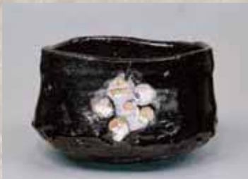
織部黒茶碗 銘「暗香」 千歳山窯 藤田等風コレクション