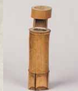
竹一重切花入 銘「移香」 昭和28年(1953)

陶芸家としても知られる創設者川喜田半泥子の周辺調査や作品の紹介は、当館の活動の大きな柱のひとつです。本展では、所蔵品や寄託作品から、川喜田半泥子の陶芸や書画作品、関連資料など約100点を展示いたします。