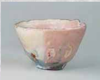
粉引茶碗 銘「雪の囀」 千歳山窯

石水博物館は川喜田半泥子(1878～1963)が昭和5年(1930)に創設した「財団法人石水会館」を母体としています。昭和47年(1972)に川喜田家より収蔵資料約3万点と「千歳文庫」の寄贈を受け、翌48年(1973)から博物館活動を開始、昭和50年(1975)12月に、三重県教育委員会の博物館登録原簿に登録されました。以来平成22年(2010)までの35年間は津市丸之内の旧津丸の内ビルで、翌23年(2011)からは津市垂水の千歳山で、地域に根差した展覧会を開催してきました。おかげさまで本年は、登録博物館として40周年を迎えます。