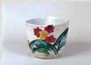
赤絵紅葉水指 廣永窯