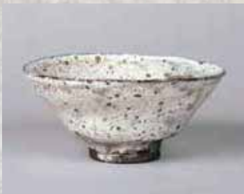
白掛茶碗 銘「天の川」 廣永窯