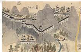
7 しのばれる北畠氏の栄光 多気国司北畠城郭地図(部分) 江戸時代中期