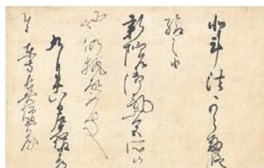
1 日野資朝の筆跡 87年ぶりに公開! 後伏見上皇院宣 鎌倉時代後期