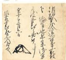
3 足利尊氏・義詮VS足利直冬 足利直冬軍勢催伏 正平10年(1355)