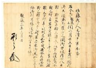
2 足利氏VS南朝 鎌倉での激闘! 佐藤元清軍状 観応3年(1352)