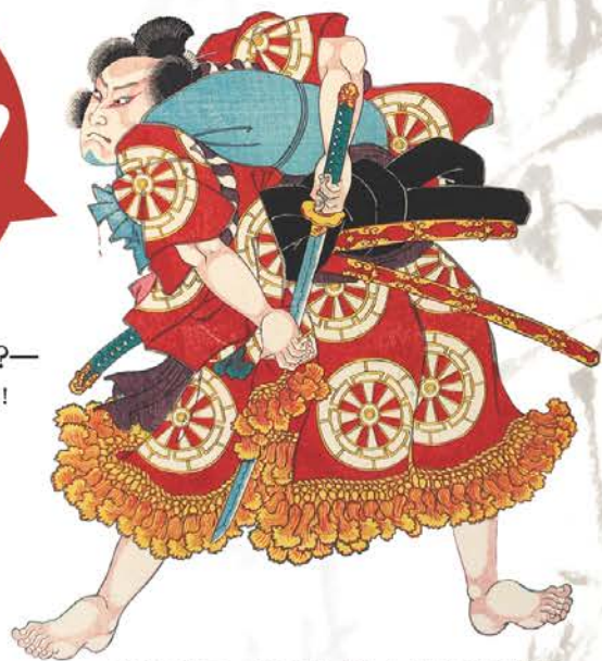
歌川国芳画 義経千本桜より佐藤忠信(部分)