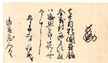
5 北畠氏VS長野氏 北畠政輝地判奉行人奉書 文明12年(1480)頃