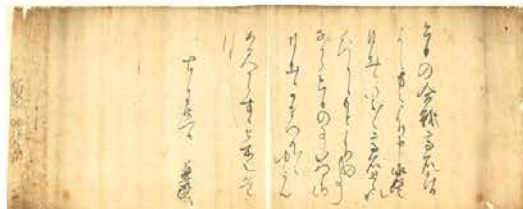
4 北畠氏VS室町幕府—北畠満雅唯一の自筆文書— 北畠氏奉行人奉書 応永22年(1415)