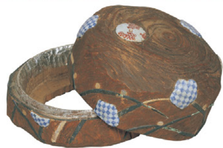
露芝模様茶臼の盒 半泥子作 館蔵